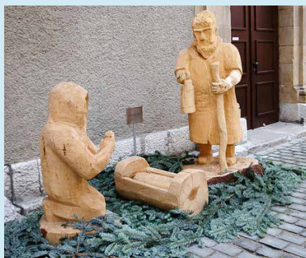
A Neuchâtel en 2015, la crèche posée sous le sapin de la ville a dû être déplacée.

A Neuchâtel, – qui se dit aussi ouvertement laïque –, une controverse est née à Noël 2015 après une décision de la Municipalité de retirer la crèche placée sous le sapin de la ville. « Il y a eu maintes réactions de chrétiens, mais le dialogue est resté positif. La Municipalité a proposé de déplacer la crèche », se rappelle le vicaire épiscopal neuchâtelois Pietro Guerini.