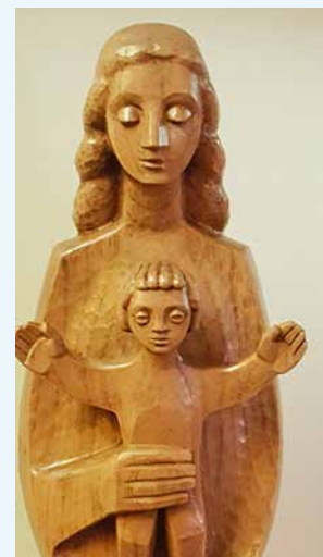
Statue de la Vierge de la chapelle du home St-François à Sion.

Donne-nous ô Marie de rester souples et ouverts, attentifs au chemin de nos sœurs et de nos frères en humanité!