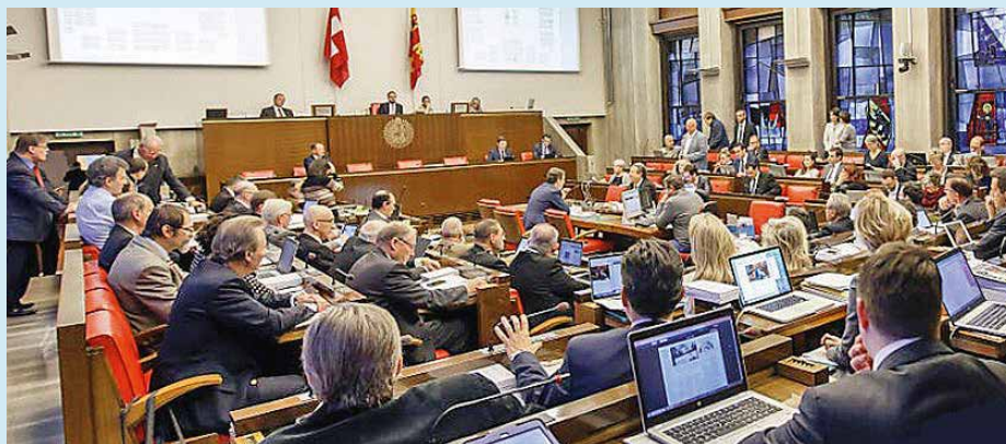
Le Grand Conseil genevois s'est prononcé sur une loi sur la laïcité, qui a généré des référendums.