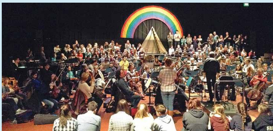
Ici joué en Grande-Bretagne, le spectacle « L'Arche de Noé » n'a pas pu être présenté en 2015 à Genève. Il l'a finalement été en novembre 2017.