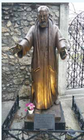
Statue de Padre Pio au couvent des Capucins à Sion

Capucin et prêtre italien, connu pour être premier prêtre et l'un des rares hommes à avoir eu des stigmates (plaies du Christ sanguinolentes aux mains, aux pieds et au thorax comme les cinq plaies du Christ), apparu dès 1918. Il a été canonisé en 2002 par Jean-Paul II.